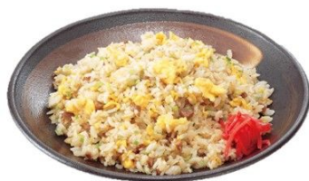
チャーハン1人前 750円